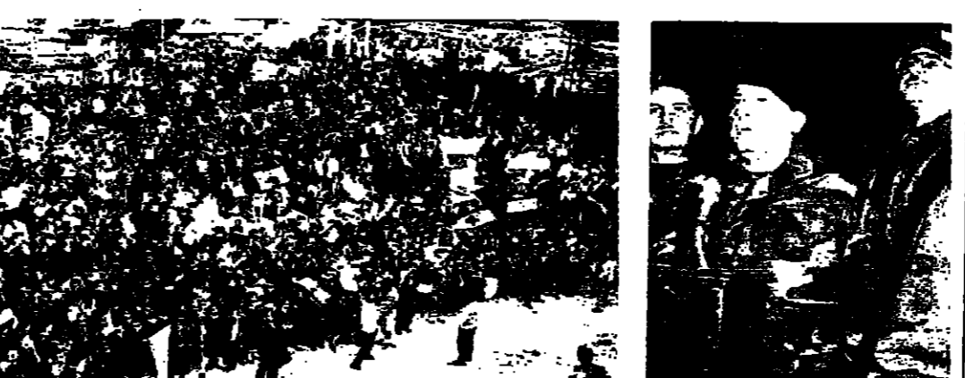
الوفود في عيدا (اليمين واليسار)

بعضهم بعضاً، صراعنا لتحرير وطننا من الاحتلال صراعنا على مستوى الوطن، وليس على مستوى وزارات او نواب، صراعنا مع المحلل على مستوى القيم وتزاعنا معه لطرده من ارضنا، ليعود مواطنونا، واخوتنا في الشمال احراراً، من هذا المفهوم تتوجه الى امنا في الشمال ليكونوا قبضة واحدة قلباً واحداً وفكراً واحداً في يوم التضامن، ويعبروا بصراحة واحدة ليرجع المحتل بطريقة سلمية كي لا يعذبنا ويعذب نفسه اكثر، لانه في النتيجة سيخرج والوضع الثالث وقد احدث ضجة ولكن كان زبونية في فحجان، وهو موضوع حرية الصحافة في الاعلام.